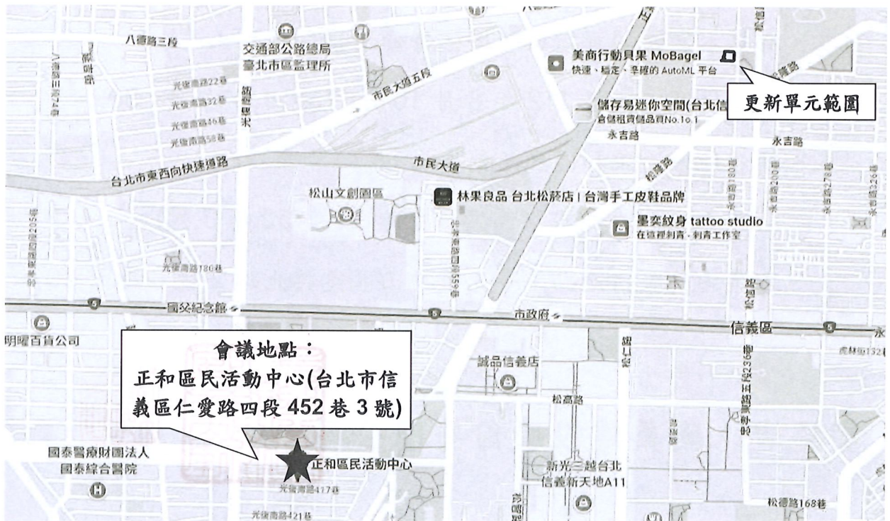
圖 2 開會地點位置示意圖