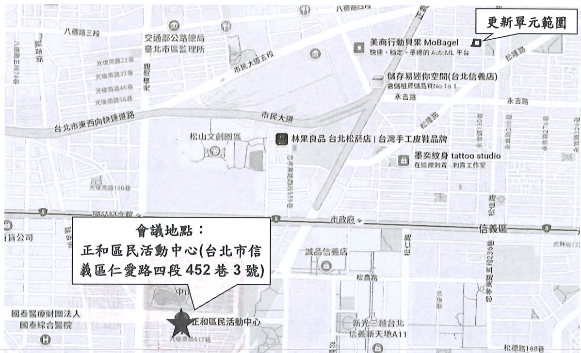
圖 2 開會地點位置示意圖